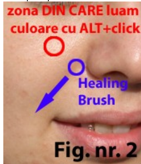
Fig. nr. 2

Healing Brush se alege din bara de instrumente, conform Figurii nr. 1.