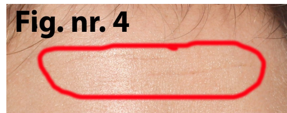
Fig. nr. 4

Vom corecta acum ridurile de pe frunte, evidentiate in Fig. nr. 4, folosind aceeasi tehnica.